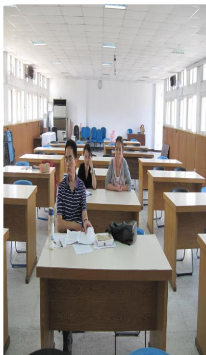
10/26 委員們審查「戒煙教育」 實施辦法