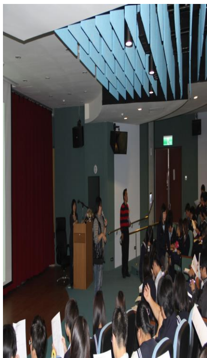
11/01 舉辦「健康與飲食」 專題演講