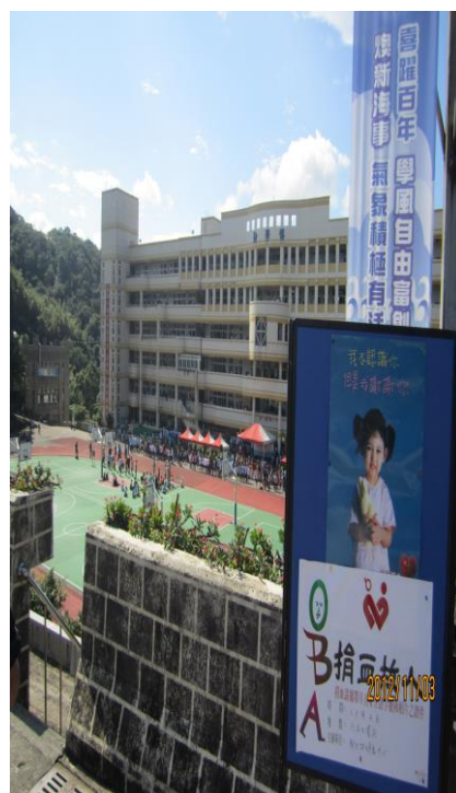
11/03 校慶辦理捐血活動(二)