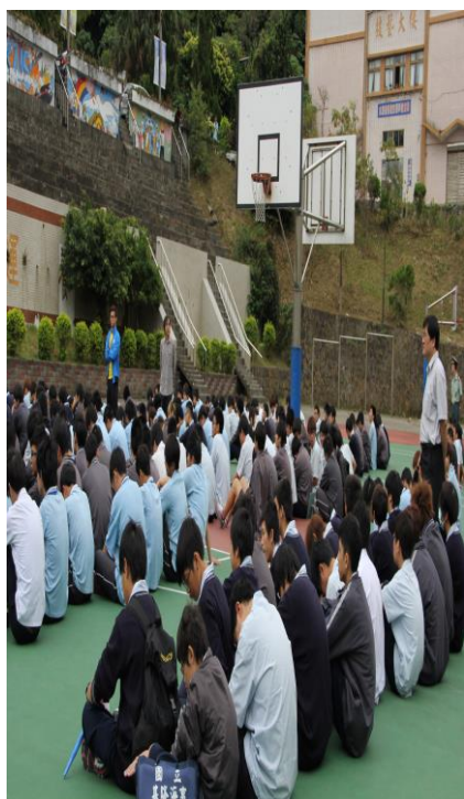
全校師生形成共識並獲得 導師支持