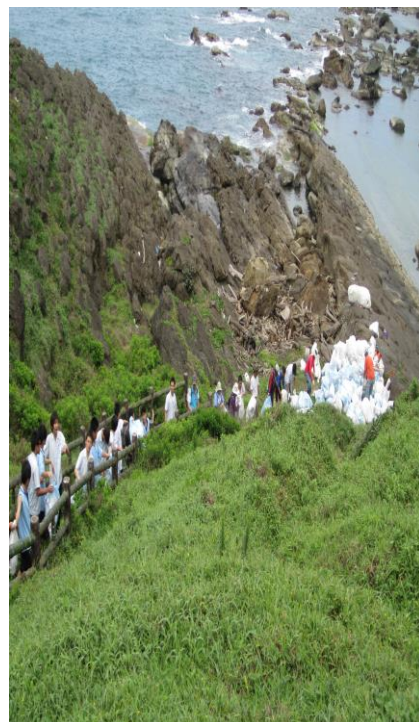
同學們袋袋相傳(四)