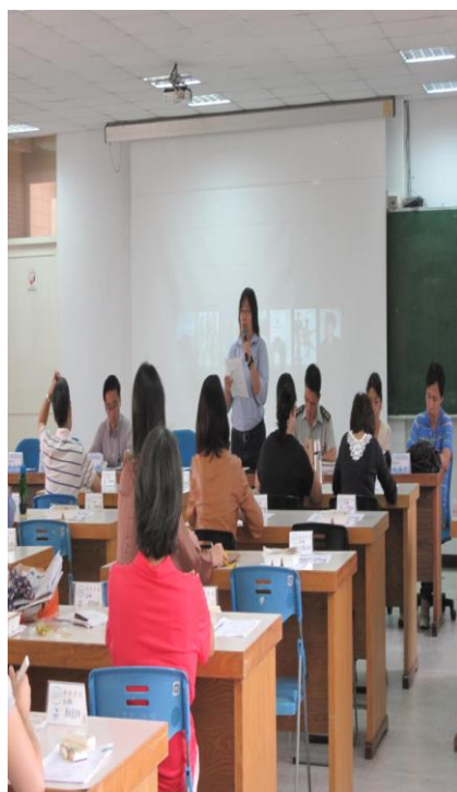
10/25 學務主任利用導師會議宣導 「戒煙教育」的重要性(一)