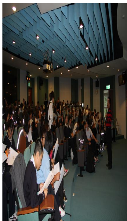
參加同學勇於發問值得鼓勵