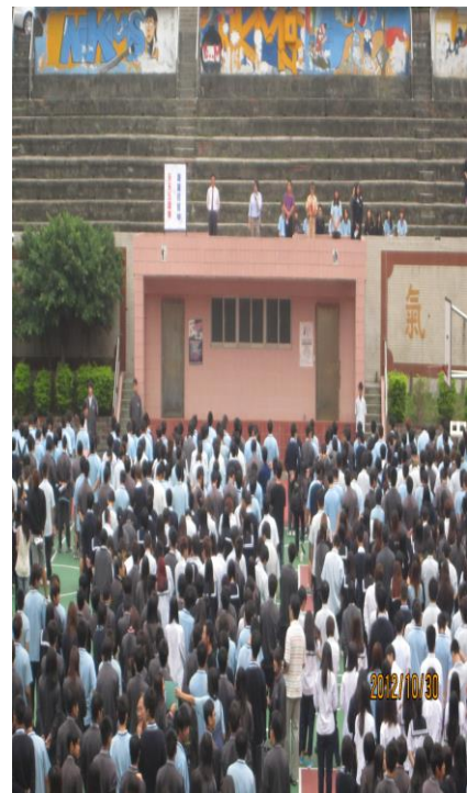
全校教職員生全力支持「無菸校 園」，大家一起說「NO」