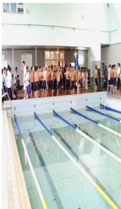
體育組辦理「水上運動會」(一)