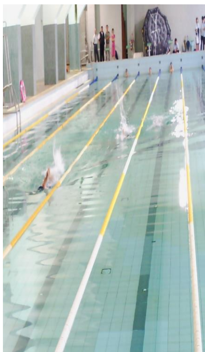
體育組將游泳課程融入健康促進 議題(一)