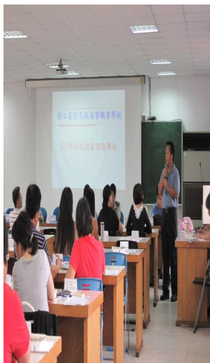
衛生組長向導師報告「戒煙教育」 實施計畫內容