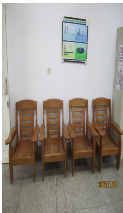
健康中心提供更舒適、更溫馨 的空間