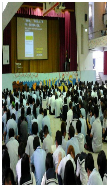
全校師生共同參與專題演講