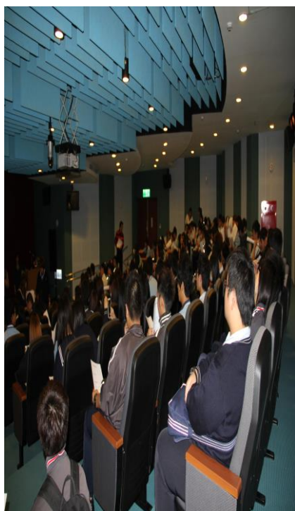
各處室主管施力宣導「戒煙教育」 的重要性