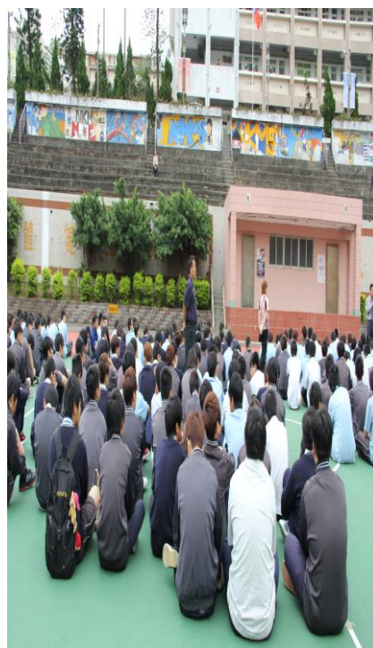
教官室說明「春暉專案」的 重要性