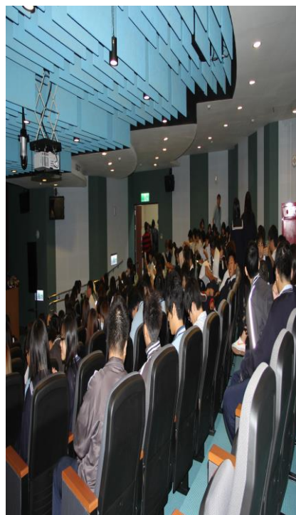
報名活動「戒煙教育」的同學 ，全神貫注