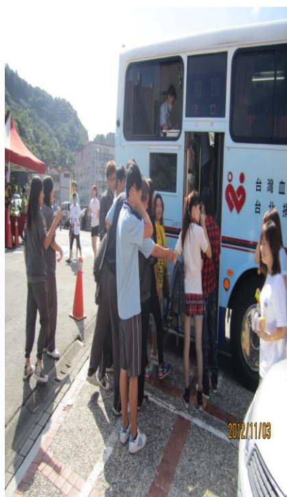
11/03 校慶辦理捐血活動(三)