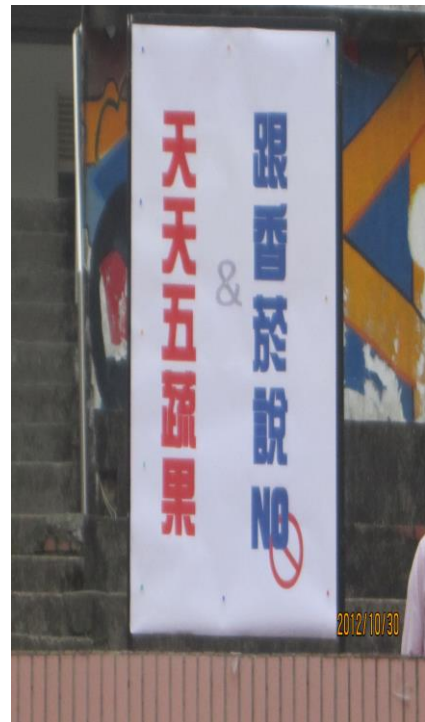
戒煙教育標語宣導