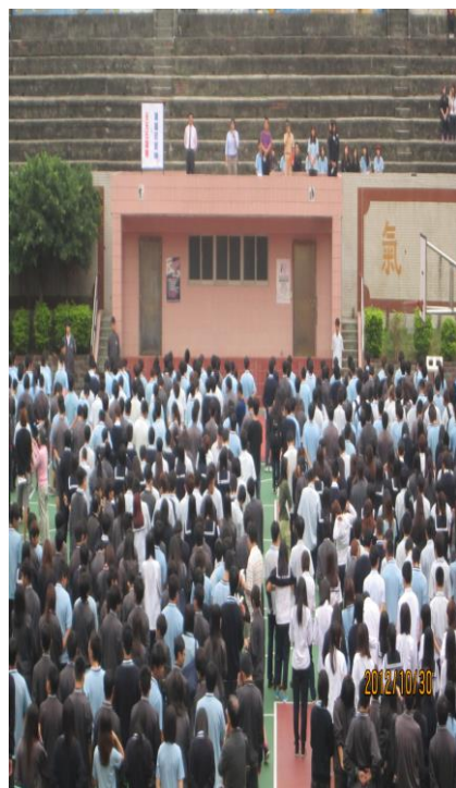
無菸校園已形成全校共識