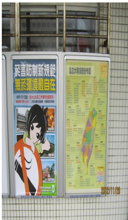
健康中心利用公佈欄宣導 「菸害防治」(一)