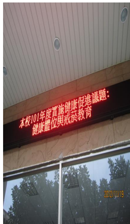
總務處利用 LED 跑馬燈宣導 「戒煙教育」(二)