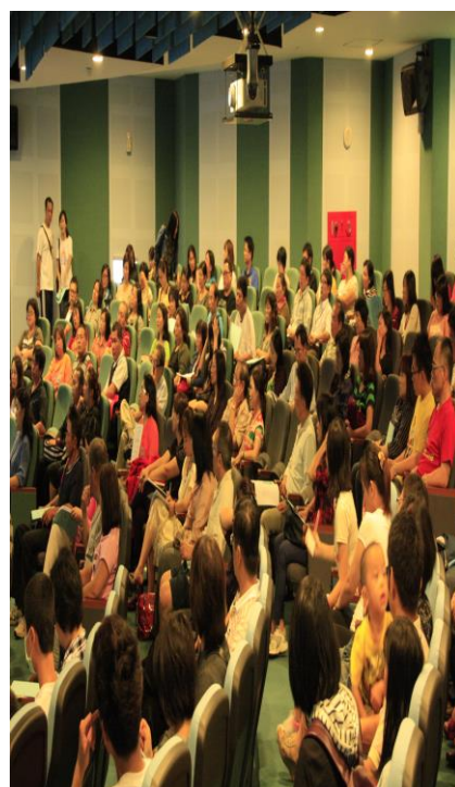
各班級家長踴躍發言並提出建議