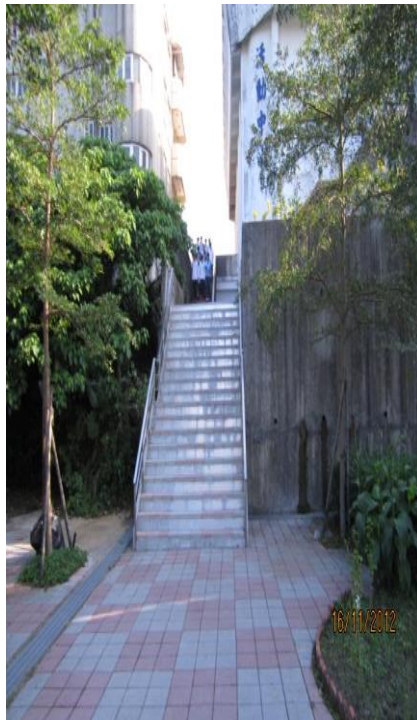
總務處完成樓梯連貫工程