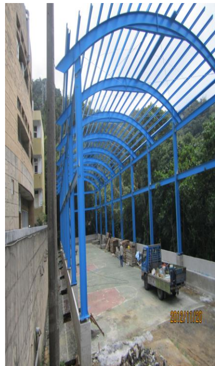
即將完工的運動廣場，增加 教職員工活動空間(二)