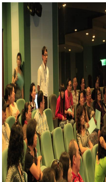
班導師全力配合「親師座 談會」