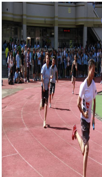
體育組辦理各項田徑比賽