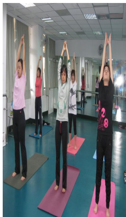
教職員工辦理運動休閒活動(二)