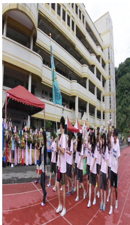
全校教職員生總動員(二)