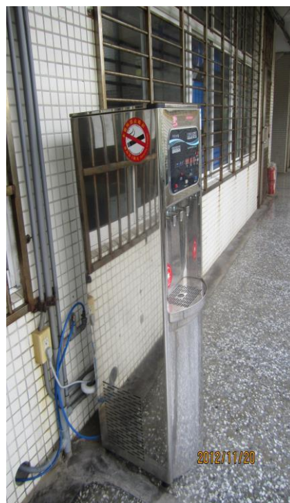
總務處定期檢驗飲水並鼓勵同學 多喝水