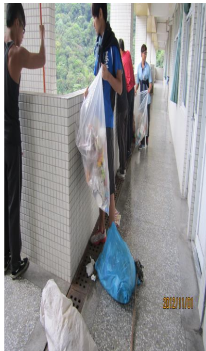
「戒煙班」同學認養學校環境整理 (四)