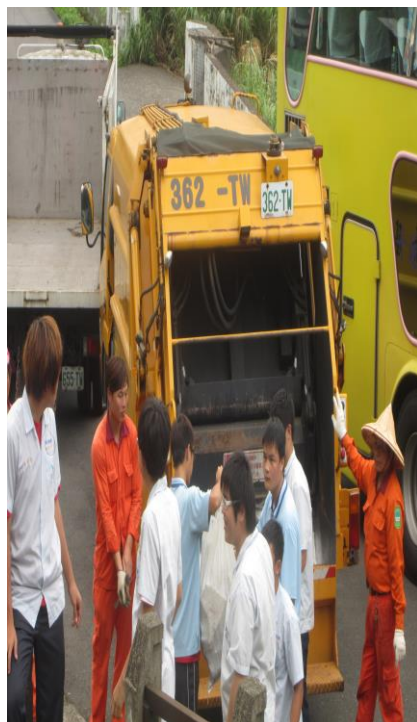
整合社會資源辦理「環保回收」