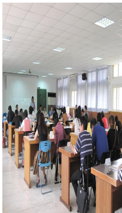
10/25 學務主任利用導師會議宣導 「戒煙教育」的重要性(二)