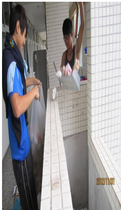
「戒煙班」同學認養學校環境整理 (三)