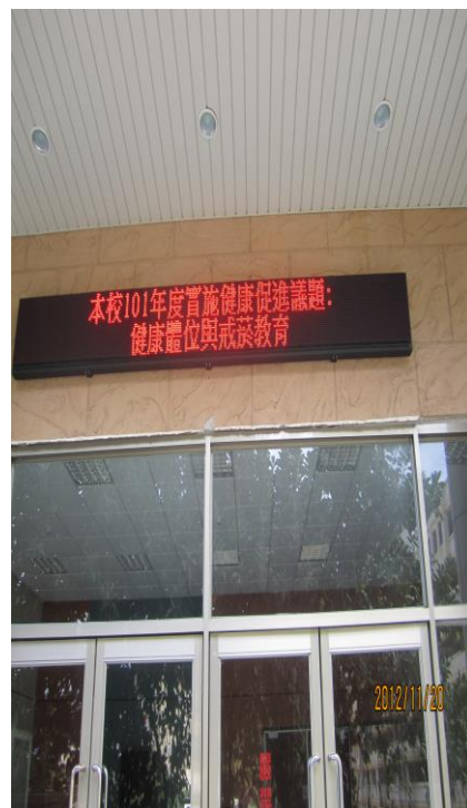
利用 LED 跑馬燈達到議題 「行銷」效果