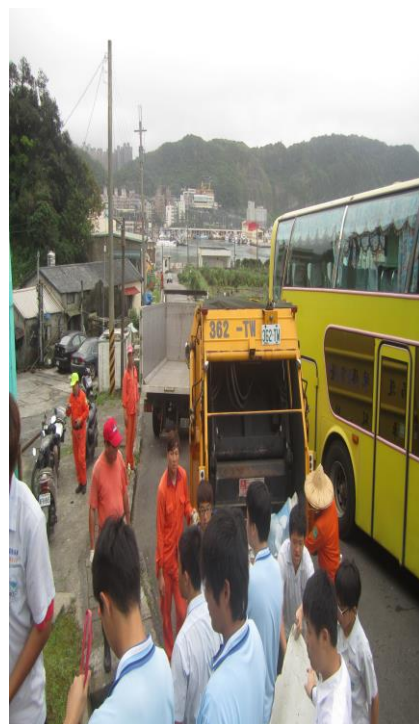
「戒煙班」同學參與淨攤活動