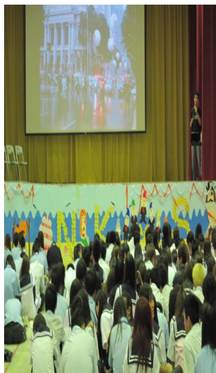
高一高二參加「心靈雞湯」 專題演講