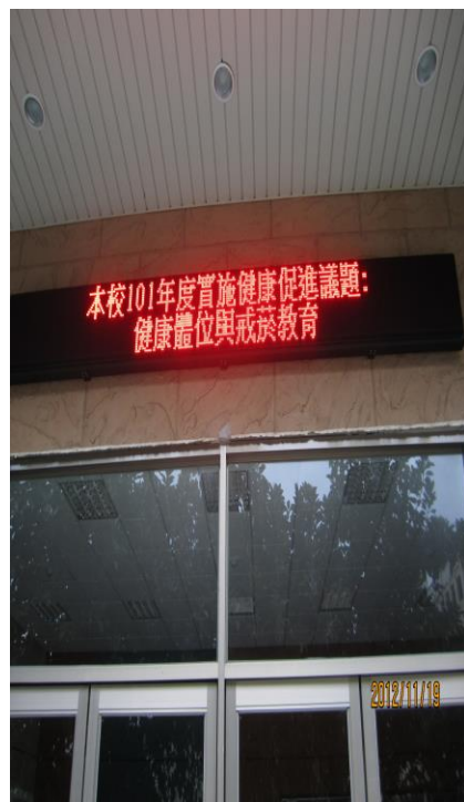
總務處利用 LED 跑馬燈宣導 「戒煙教育」(一)