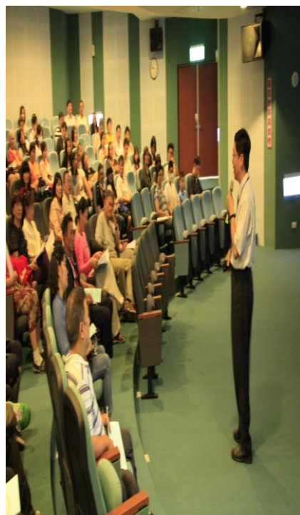
輔導室辦理「親師座談會」