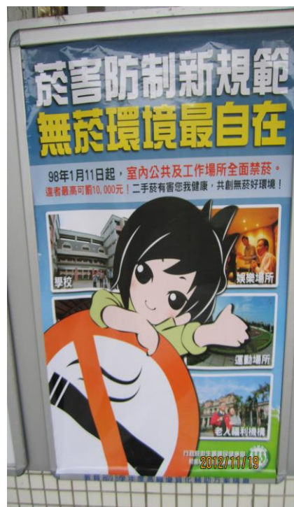
健康中心佈置「戒煙」標語教室 (二)