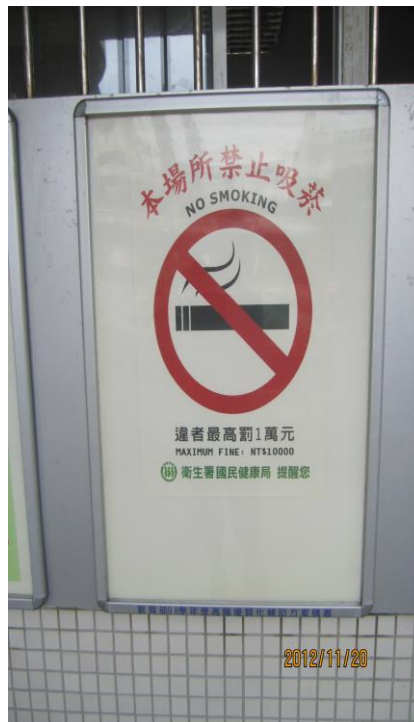
設置「標語」提醒全校教職員生，校 園是禁菸區