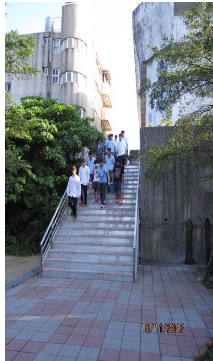
樓梯連貫工程形成環繞校園 健走步道