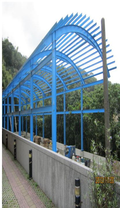
即將完工的運動廣場，增加 教職員工活動空間(一)