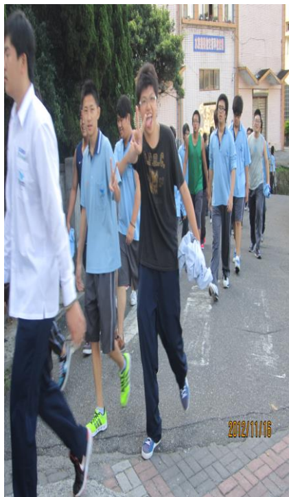
實施第一次「戒煙教育」- 慢跑活動(三)