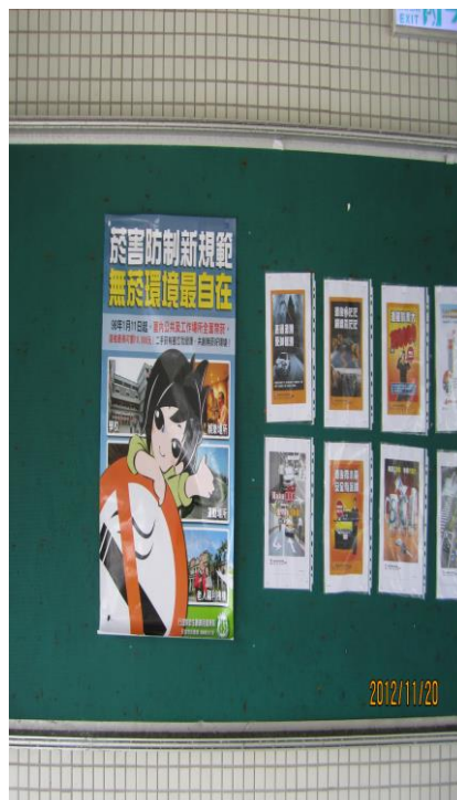
健康中心利用公佈欄宣導 「菸害防治」(二)