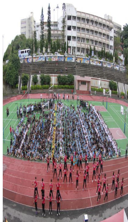
全校教職員生總動員(三)