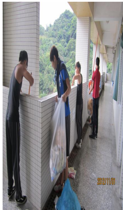
「戒煙班」同學認養學校環境整理 (二)