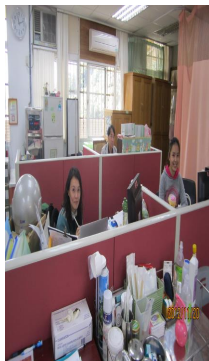
健康中心總動員辦理「戒煙教育」