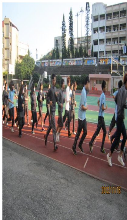
實施第一次「戒煙教育」- 慢跑活動(二)