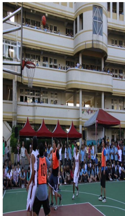
體育組辦理各項球類競賽