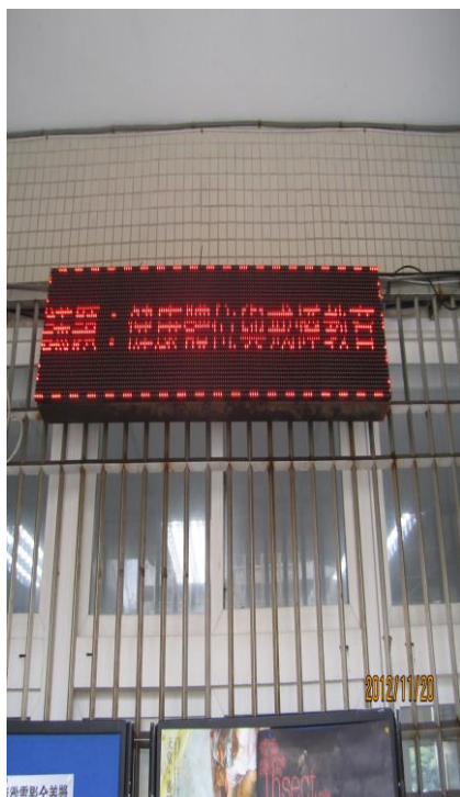
總務處完成 LED 跑馬燈宣導 「戒煙教育」