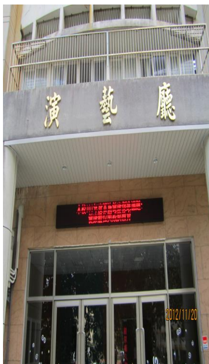
新完工的演藝廳提供全校師生 研習會議的好場所