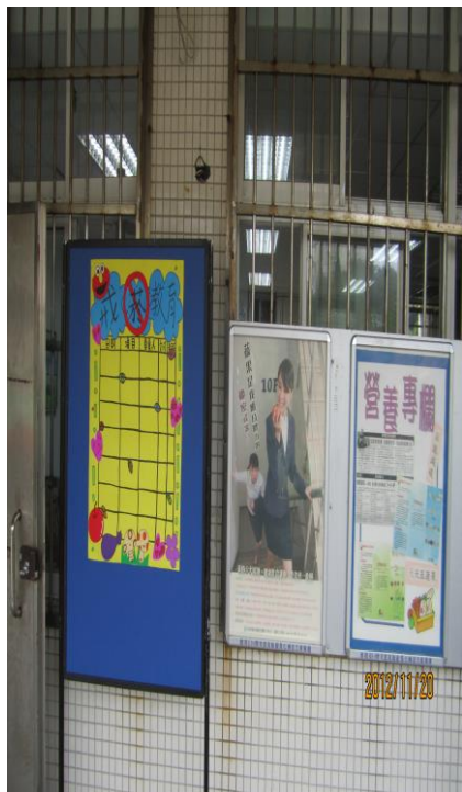
健康中心利用公佈欄宣導 「菸害防治」(三)