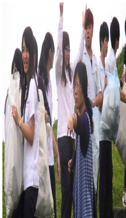
同學們袋袋相傳(二)