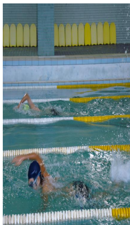
體育組辦理「水上運動會」(二)