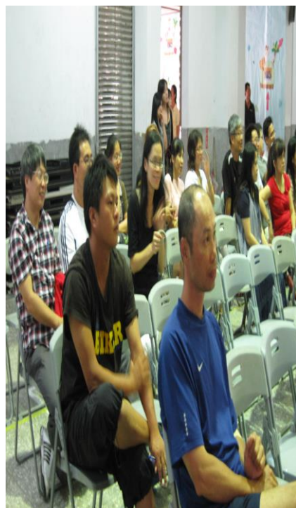
全校教職員生熱烈參與(二)