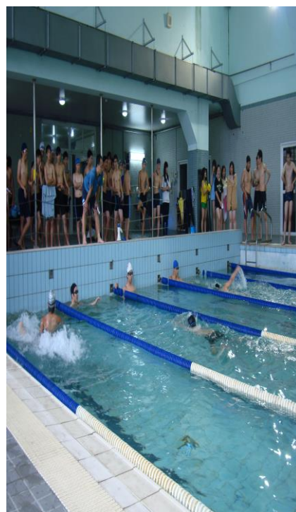
體育組將游泳課程融入健康促進 議題(二)