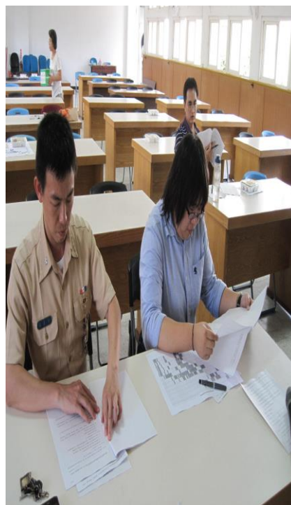
10/26 召開第一次健康促進會議