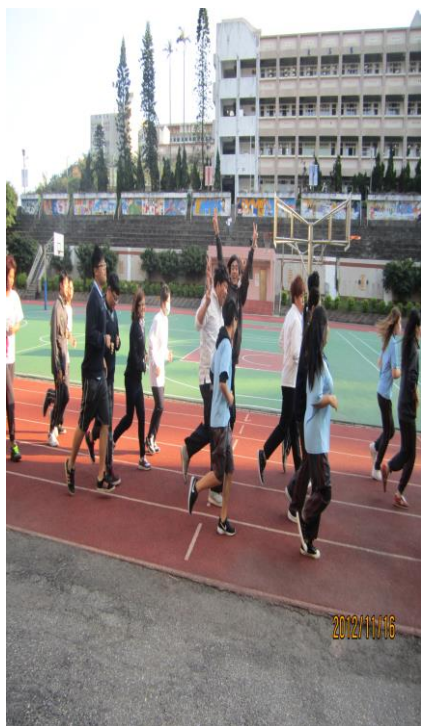
實施第一次「戒煙教育」- 慢跑活動(一)