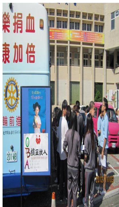
11/03 校慶辦理捐血活動(四)