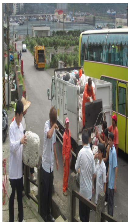
同學付出，深獲肯定