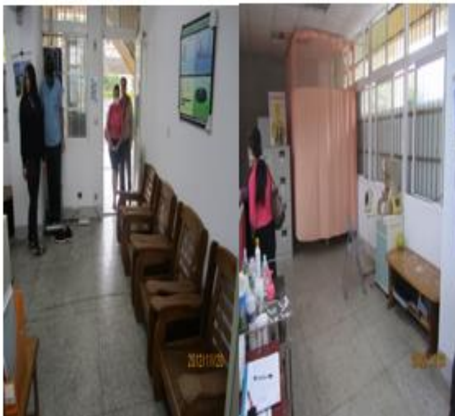
健康中心提供「戒煙」健康諮詢，每週二、四駐校醫生協助同學「戒煙」