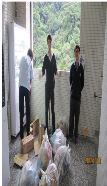
「戒煙班」同學認養學校環境整理 (一)