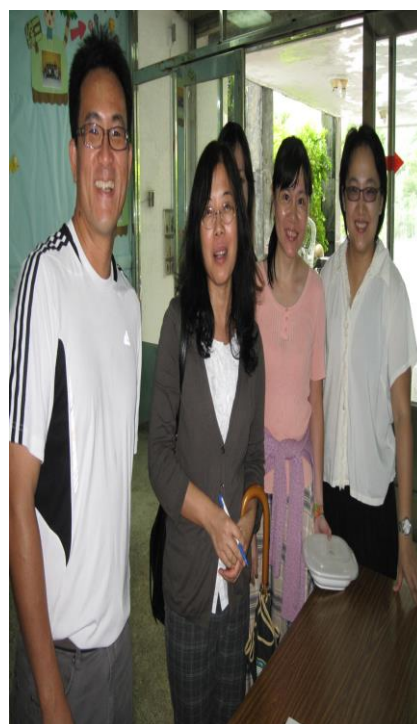
全校教職員生熱烈參與(一)