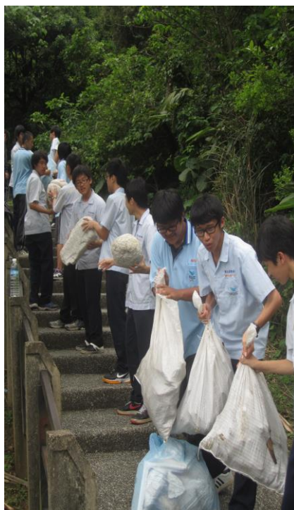
同學們袋袋相傳(一)