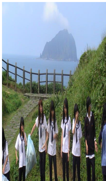
同學們袋袋相傳(三)