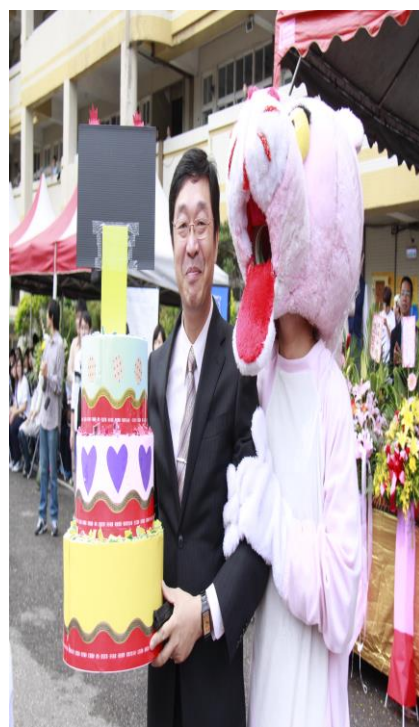
全校教職員生總動員(一)