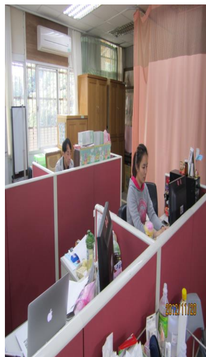
健康中心擬定「戒煙教育」活動 與評量