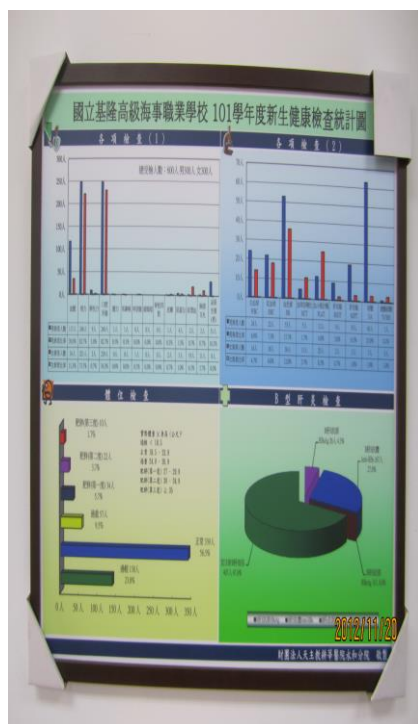
完成高一新生體檢讓同學更能 掌握自己健康