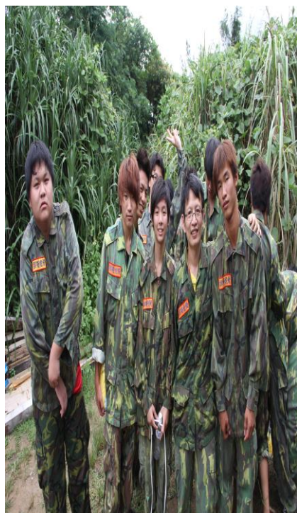
9/27 陳銓校長利用高一生活體驗營宣導「無菸校園」的概念(三)