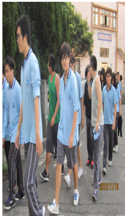
實施第一次「戒煙教育」- 慢跑活動(四)