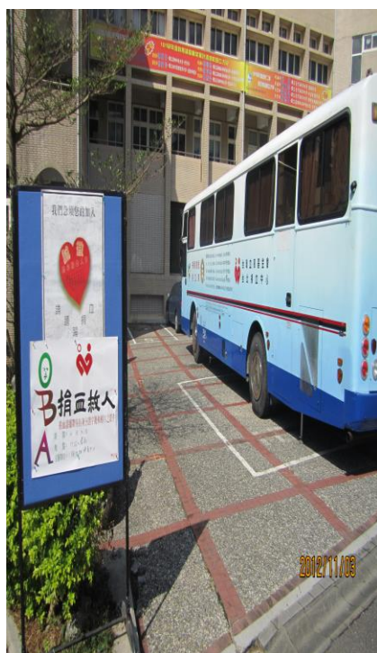
11/03 校慶辦理捐血活動(一)