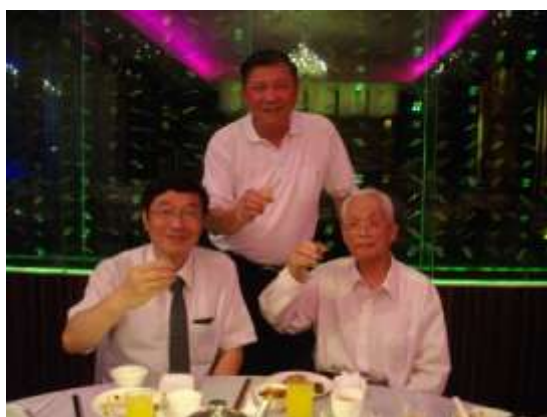
捐贈禮成會後，於水園會館餐敘，校長、榮譽董事長及莊董事和影