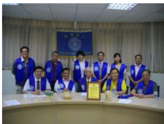
出列席貴賓及董事和影