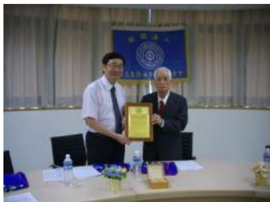
施榮譽董事長啟文捐贈紀念牌