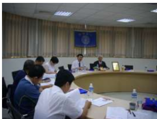
陳校長代理董事長主持董事會