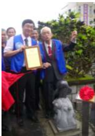
海豚雕像揭幕前觀禮合影留念