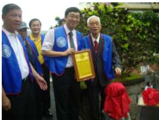
海豚雕像揭幕前觀禮合影留念