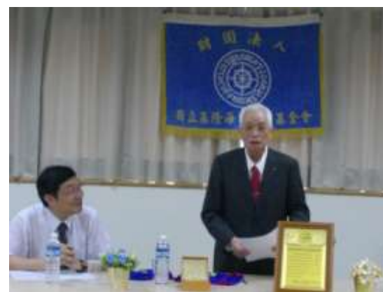
施榮譽董事長致勉勵辭