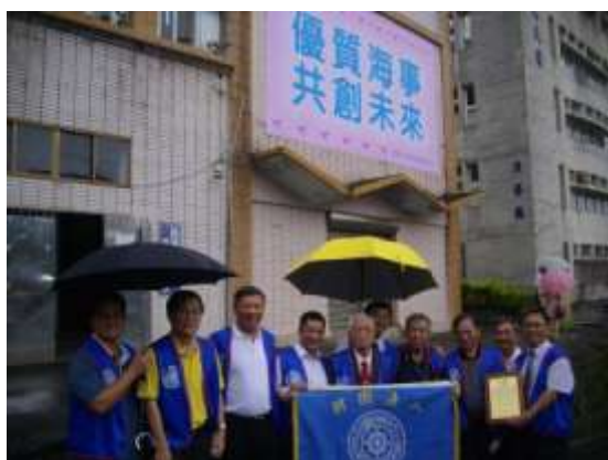
本會積極協助校務發展，貴賓及董事們在優質海事共創未來之招生看板前和影