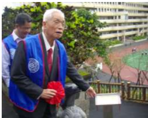
榮譽董事長於解說牌前介紹本會精神